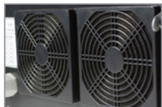
Kühlung kontinuierliche Wärmeabfuhr durch Lüfter