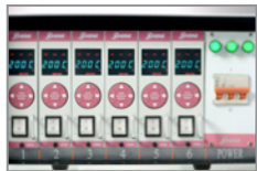
Steuern Sie intuitiv und digital