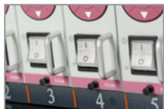
Einzelrichter schalten Sie einzelne Karten jederzeit ein oder aus