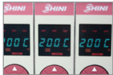
Displayanzeige Soll und Istwert Anzeige