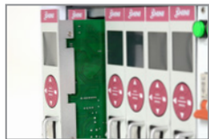
Modulare Steuerkarten ermöglichen schnellen und unkomplizierten Wechsel der Leistungskarten